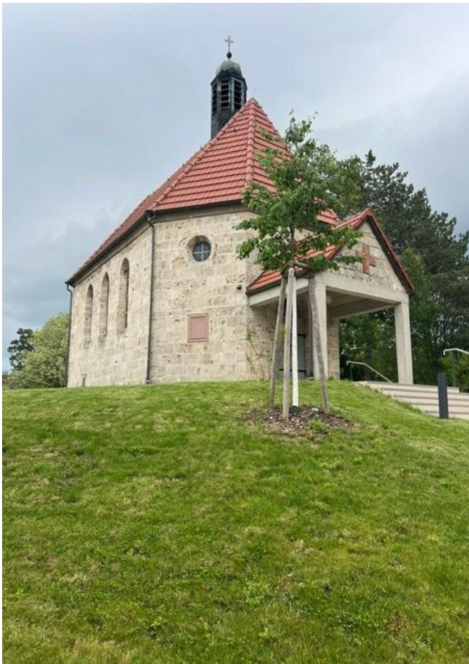
FRIEDHOF DER GEMEINDE DOTTERNHAUSEN