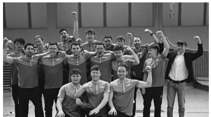
Die Meister-Teams des SV Dotternhausen