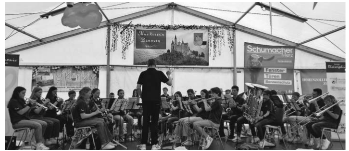
Die Jugendkapelle bei ihrem Auftritt im Festzelt