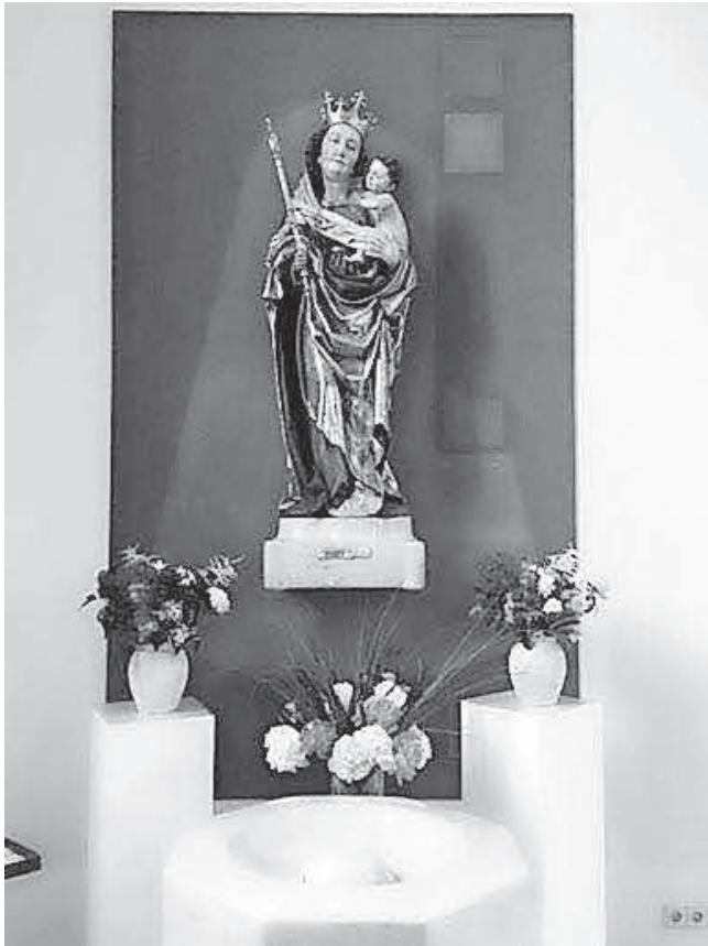
Der Marienaltar wurde liebevoll als Fronleichnamsaltar geschmückt.