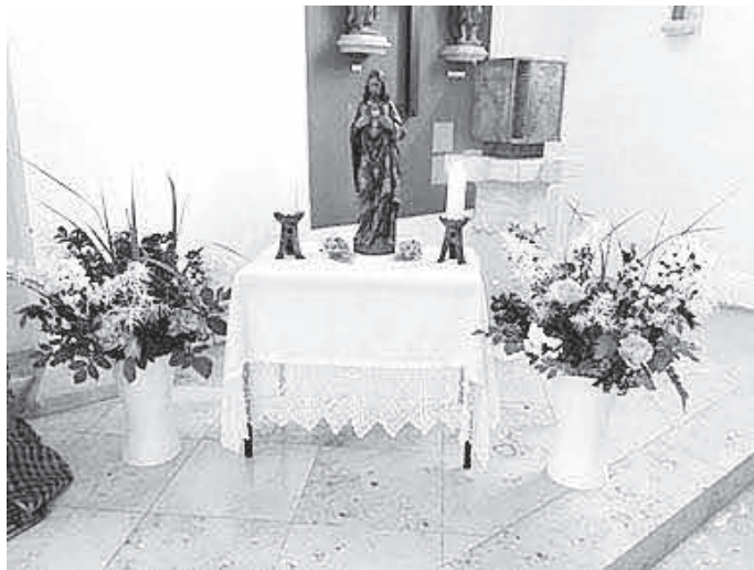
Seitenaltar mit schön geschmückten Vasen