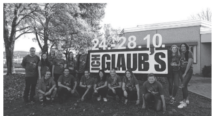
Mitarbeiter von ich glaub's in Schömberg

Eingeladen sind Jugendliche ab 12 Jahren, egal welcher Konfession. Von Dienstag, 24. Oktober bis Samstag 28. Oktober jeweils ab 19 Uhr können sie in ungezwungener Atmosphäre im evangelischen Gemeindezentrum erleben, in dem Gott im Mittelpunkt steht und deshalb der Spaß auch auf keinen Fall zu kurz kommt.